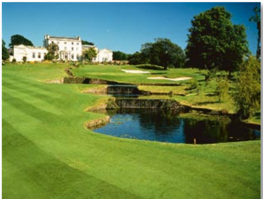
Das imposante Clubhaus des Druid's Glen Golf Course