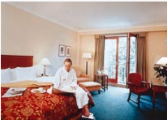
Geräumige und komfortable Zimmer

Der irische Name für Wicklow ist Cill Mhantáin, eine Provinz von Leinster, situiert an Irlands Ostküste, ca. eine knappe Stunde von Dublin entfernt. Das County Wicklow wird mit Recht «der Garten Irlands» genannt. Seine grünen Täler, pittoresken Landschaften, romantischen Wasserfälle und faszinierenden Hochplateaus mit den Feldsteinbrücken sowie Weltklasse Fairways, wie zum Beispiel jene des Druids Glen Golf Club, erfreuen die Golferherzen und Naturliebhaber.