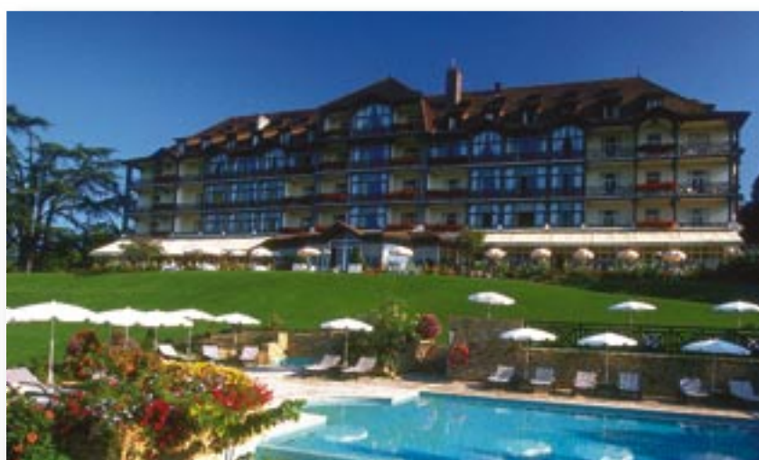
Eleganz und Stil vereinen sich hier