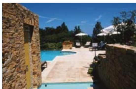
Abkühlung im Pool