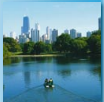
Chicago «the windy city»