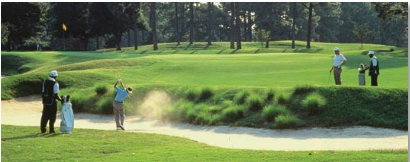
Pinehurst No. 2: Ein spektakulärer Bunker vor dem 5. Loch