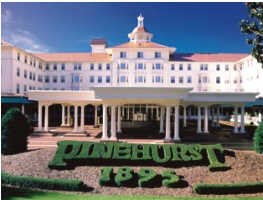
Pinehurst das Golfermekka

Dieser Bundesstaat bietet dem Besucher landschaftliche Vielfalt. Der ausgedehnte, flache Küstenstreifen am Atlantik lockt mit langen Sandstränden und mit einer selbst an heissen Sommertagen angenehm kühlen Brise. Das Landesinnere nennt sich Piedmont und weist ausgedehnte Tabakplantagen sowie mehrere historische Städte auf. North Carolina bietet mit seinen unzähligen, abwechslungsreichen Golfplätzen dem Anfänger sowie dem anspruchsvollen Golfer eine interessante Auswahl.