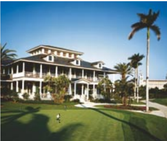
Das neue Clubhaus

Wenn Sie an Palm Beach denken, dann denken Sie sicher an Glamour, Golf, Sonnenschein und elegante Menschen. Der Eisenbahnpionier Henry Flagler gründete Palm Beach 1894 als Winterferienort für reiche Amerikaner. Eines seiner Werke war der Hotelpalast Royal Poinciana mit 2000 Zimmern. Aber dieses privilegierte Stückchen Florida, übrigens das grösste County südlich des Mississippis, hat weitaus mehr zu bieten: von weltweit einzigartigen Einkaufsmöglichkeiten über kulturelle Attraktionen und Sehenswürdigkeiten bis hin zu endlosen weissen Sandstränden und familienfreundlichen Freizeitangeboten finden Sie alles, was das Herz begehrt. Palm Beach County erstreckt sich über 75 km entlang der «Golden Coast» Floridas und liegt nur ca. 1 Std. nördlich von Fort Lauderdale, 1,5 Stunden nördlich von Miami und 2,5 Stunden südlich von Orlando entfernt. Sportler können sich auf über 145 Golfplätzen und 1100 Tennisplätzen messen.