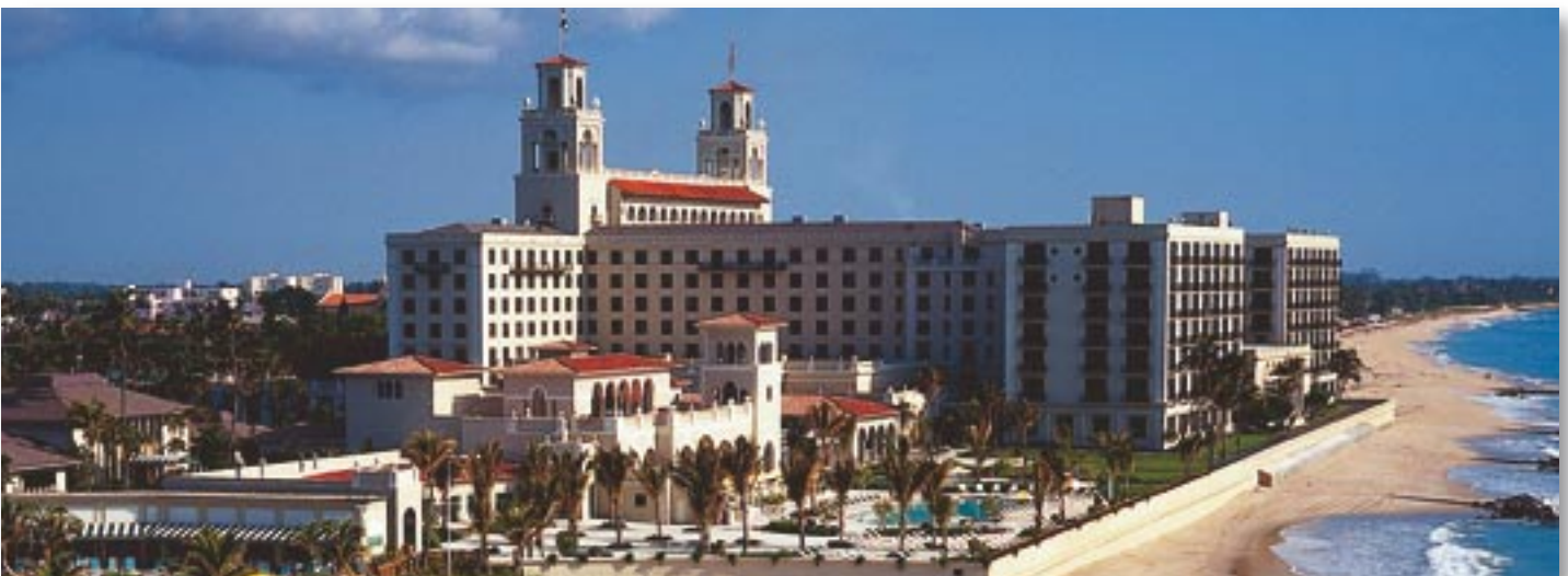
Erholung und Entspannung exklusiv