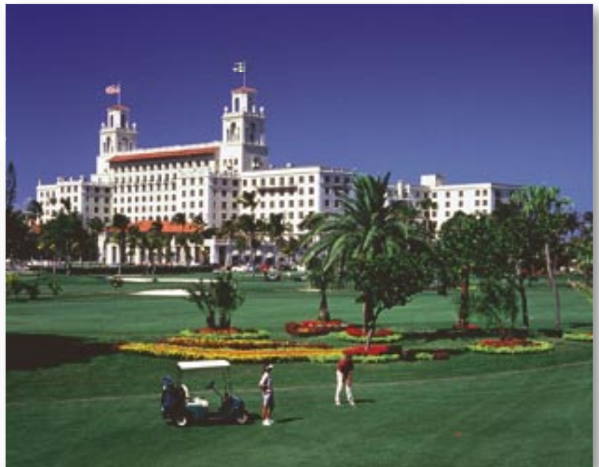
Majestätische Dominanz: The Breakers

Zwei 18-Loch Golf- und 14 Tennisplätze, Finesseinrichtungen und Fahrradverleih runden das Sportangebot ab. Alle 572 Gästezimmer sind mit Telefon, Fön, TV, Safe, Bügelutensilien, Minibar und Klimaanlage ausgestattet. Eine wahre Ferienoase für den anspruchsvollen Gast.