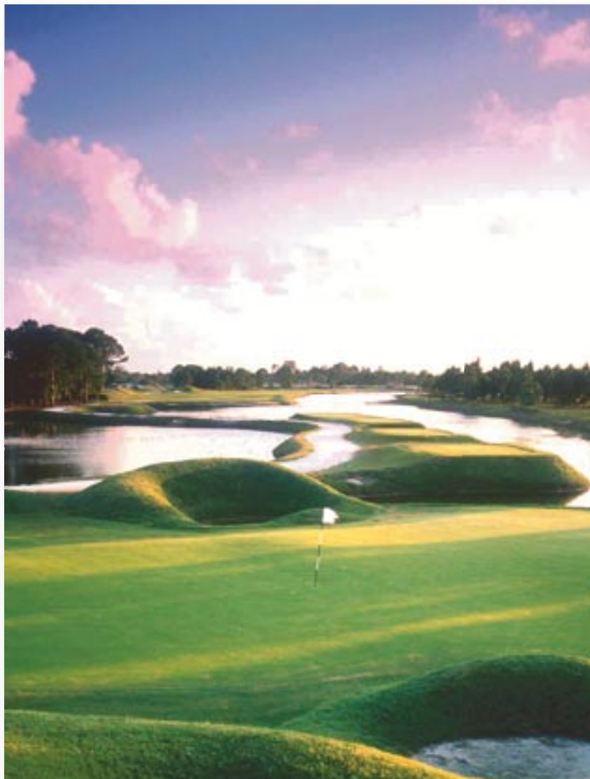
Fairways zum Träumen