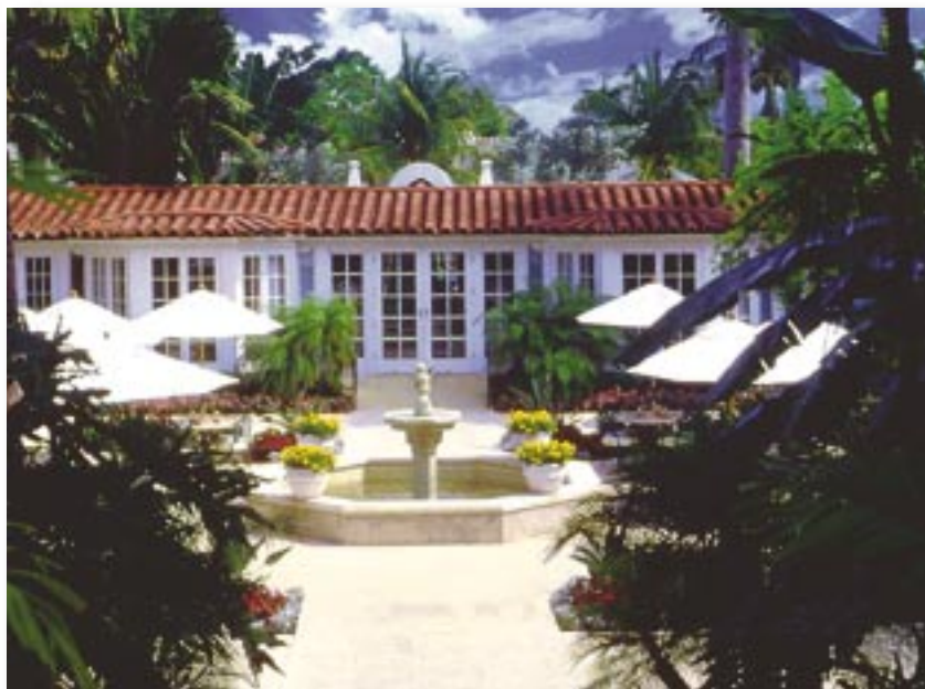
Kolonialstil und tropisches Ambiente

1926 eröffnete The Brazilian Court seine Tore. Fünf Jahre später entstand das legendäre Restaurant «Dining al Fresco», welches von Botschaftern, Stars wie Judy Garland, Erol Flynn, Gary Grant und vielen andern besucht wurde. Heute bietet das elegante Hotel im Herzen von Palm Beach einen idealen Ausgangsort für luxuriöses Shopping an der Worth Avenue, Sightseeing und natürlich Golfen. Die 103 Zimmer, alle mit verschiedener Ausstattung, wurden vor kurzem renoviert. Sie verfügen alle über Kitchenette, Bar, Kabel-TV, Videorecorder, CD Spieler, Dataport, Telefon, Bademantel, Bügelbrett und vieles mehr. Der Innenhof im mediterranen Design mit seiner exotischen Pflanzen- und Blumenpracht bietet sich nach einem erlebnisreichen Tag als erholsame Oase an. Der kleine Spa sowie ein 24-Stunden Service runden das vielfältige Angebot ab und verwöhnen den anspruchsvollen Gast. Das neue Feinschmecker-Restaurant «Café Boulud Palm Beach» wurde im Dezember eröffnet.